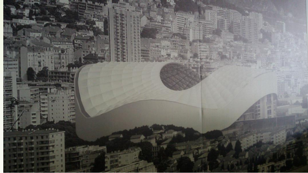
Le stade Vélodrome