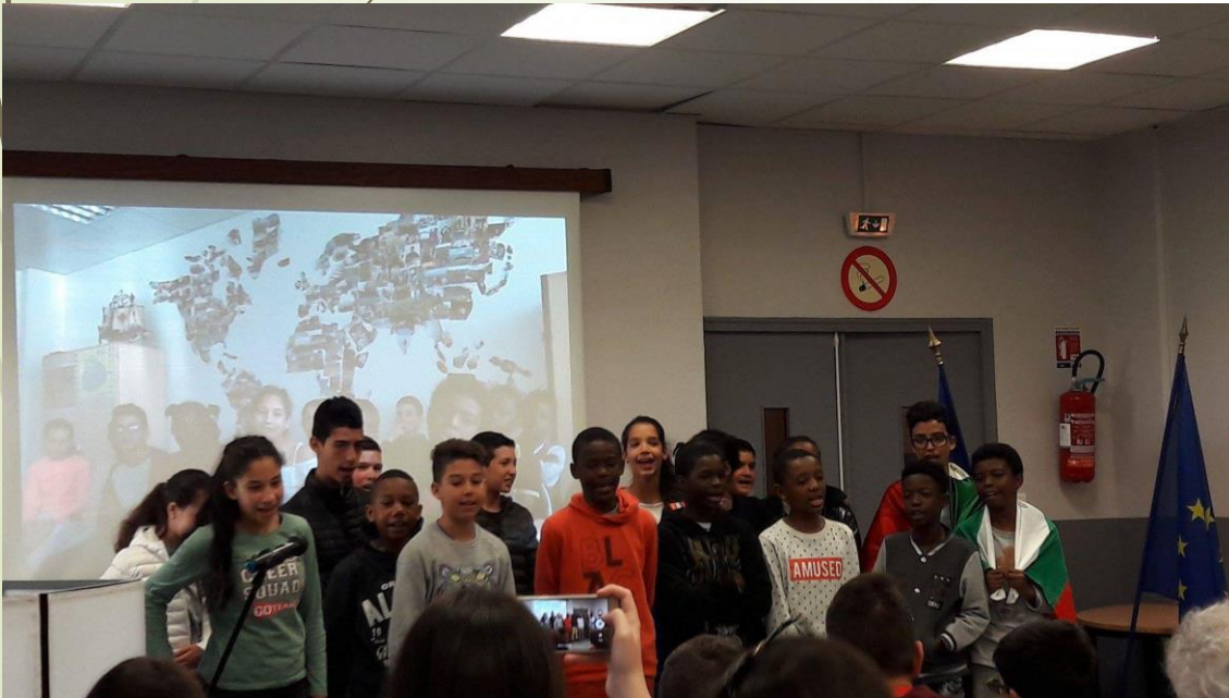
Les français chantent.