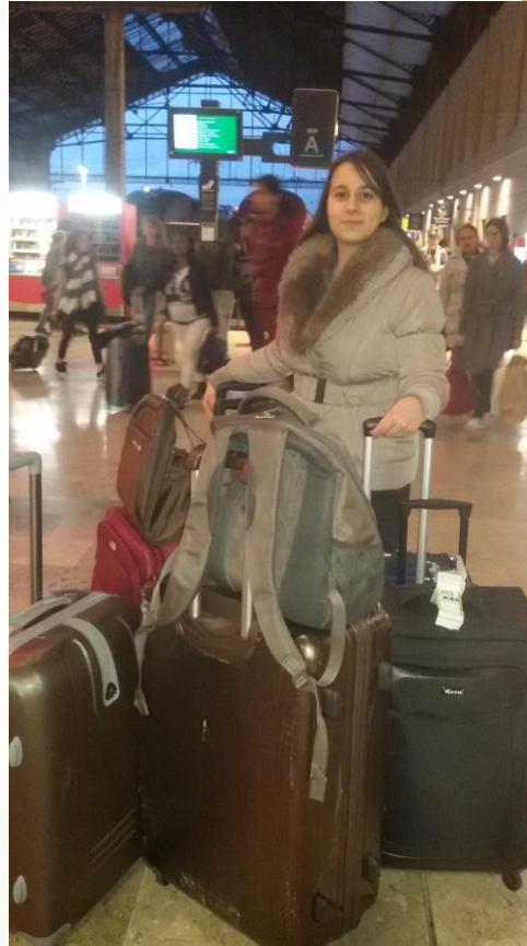
Je garde des valises.