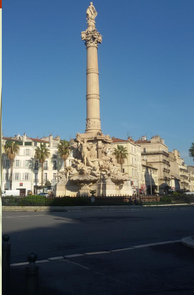
La Place Castellane