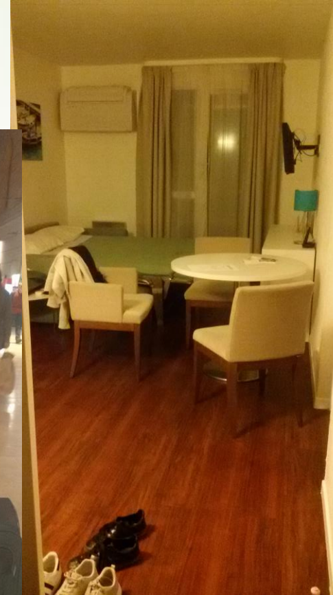
Notre chambre. Nos colocataires étaient Allemandes.