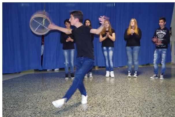
Ο χορός των Κυπρίων

Οι γερμανοί μαθητές έφτιαξαν ένα μικρό βίντεο με θέμα: «Ποιος έκλεψε το μετάλλιο;» . Σύμφωνα με τους μαθητές ο κλέφτης του μεταλλίου ήταν η καθηγήτριά τους.