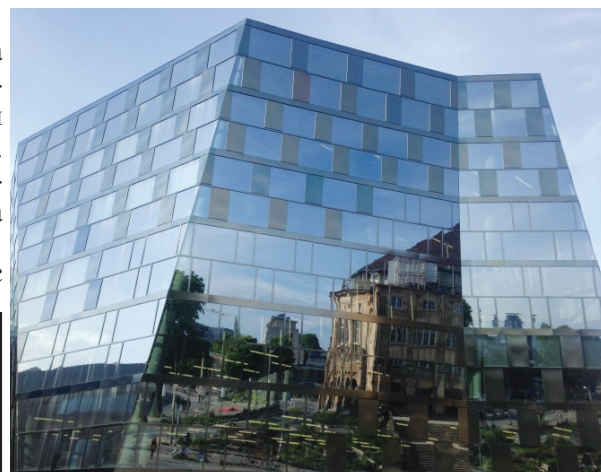
Библиотеката на университета във Фрайбург

Езикова гимназия „Нейо Яворов“ - Силистра Проект 2016 / 2017