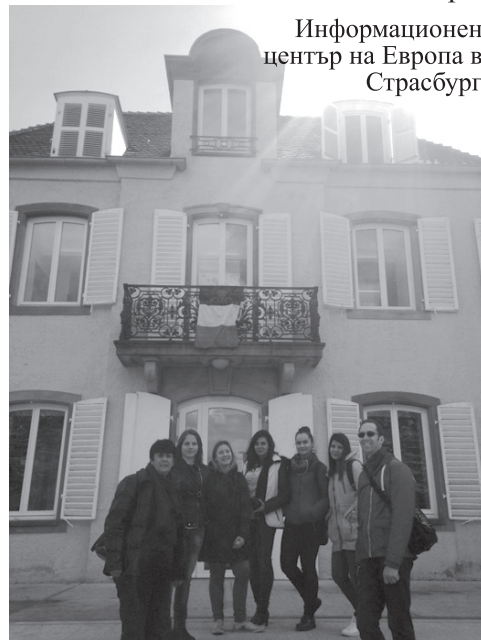
Информационен център на Европа в Страсбург

минало време на романтика и спокойствие. Макар и само след час обаче, всички ние – участниците по проекта “Partagons nos valeurs dans l’effort”, се срещнахме щастливи, от това, че сме споделили тези моменти заедно – пре-