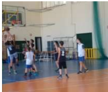
Στιγμιότυπα από τους αγώνες μπάσκετ του σχολείου μας